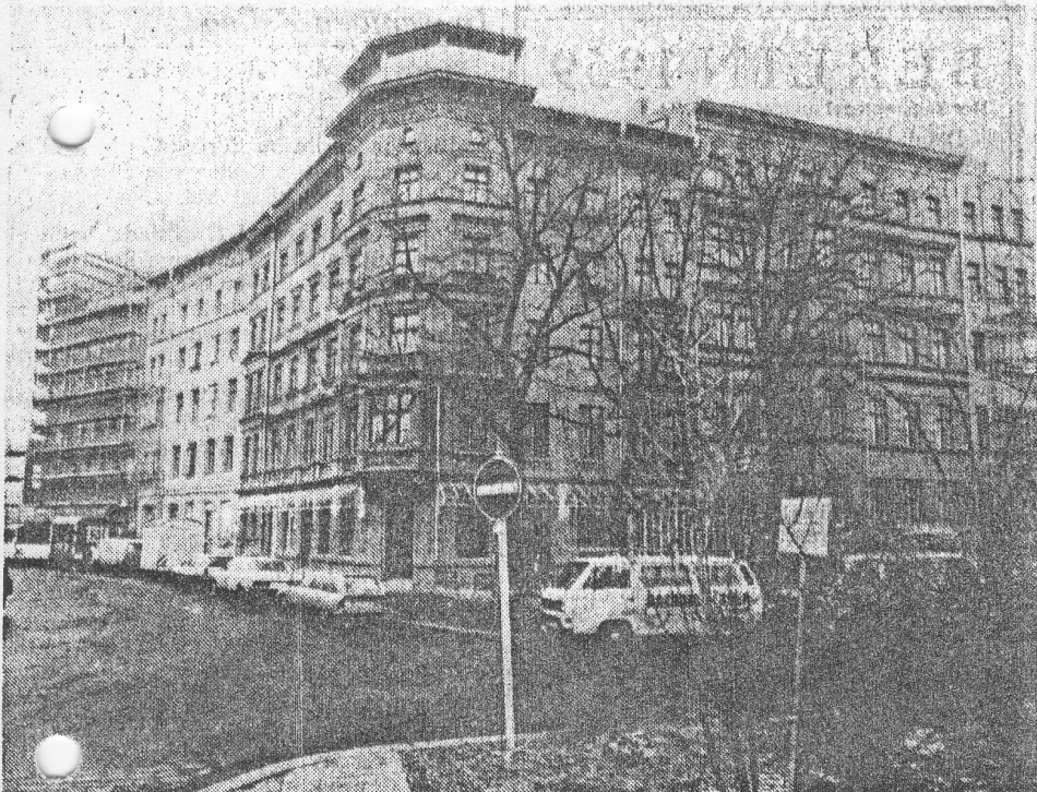
An ungewöhnlichen Details erkennbar. Erker und Glastürmchen wurden bei dem ursprünglich zum Abriß vorgesehenen Gebäude-Ensemble am Kreuzberger Wassertorplatz angebracht (oberes Foto). Gefördert wird beim Selbsthilfe-Projekt auch die Anlage luftiger Wandelgänge und Dachterrassen (unten).

Professor Hämer von der Internationalen Bauausstellung (IBA) stört sich an der recht düsteren Farbgestaltung des Ensembles. Von den Bewohnern wurde die Tönung als „erdverbunden und schmutzbeständig“ ausgewählt. Außerdem weist man „als Ausgleich“ auf die bunten Erker, die „wie Schmetterlinge“ wirkten, für kritische Nachbarn eher „Vogelkäfige“ sind.